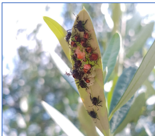
Ovatura di cimice asiatica con neanidi di prima e seconda età-areale Lario