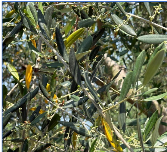
Fase fenologica-areale Sebino